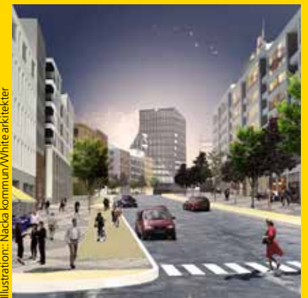
Illustration: Nacka kommun/White arkitekter

Boende på Nya gatan i korsningen Vikdalsvägen och Värmdövägen får nära både till staden och Nackas fantastiska natur.