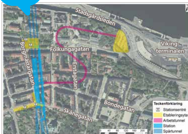
Illustration över var stationsentrēerna vid Sofia planeras att ligga. Från Londonviadukten kommer en arbetstunnel byggas i berget. De gula ytorna visar var byggarbetsplatserna planeras att läggas. Motsvarande illustrationer finns för alla delsträckor och stationer på sll.se/nyatunnelbanan och på våra Öppet hus.

Under perioden 8 oktober – 2 november kan du lämna in dina synpunkter. Din lokalkännedom är viktig i vårt fortsatta arbete.