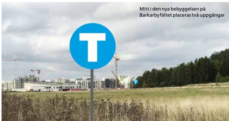
Mitt i den nya bebyggelsen på Barkarbyfältet placeras två uppgångar