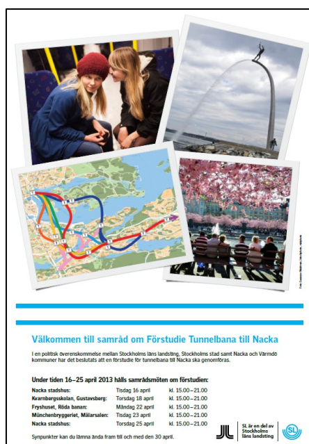
Figur 2. Framsida på samrådsbroshyr, april 2013

Under samrådstiden fanns översiktlig information om pågående förstudie på sll.se/tbananacka . Där kunde även samrådsbroshyren laddas ner.